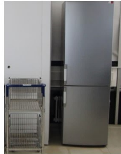
2 x Kühl/Gefrierschranke 2 x Geschirrwagen