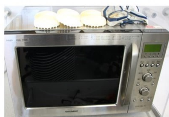
Mikrowelle + Zubehör