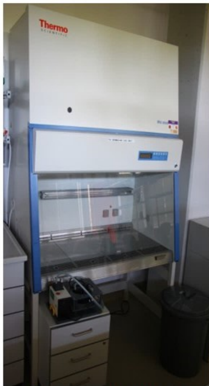
2 Thermo Sterilbänke 2 Absaugpumpen