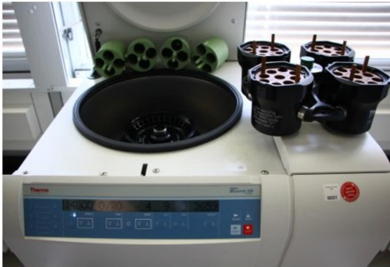
Kühlzentrifuge Thermo + Adapter