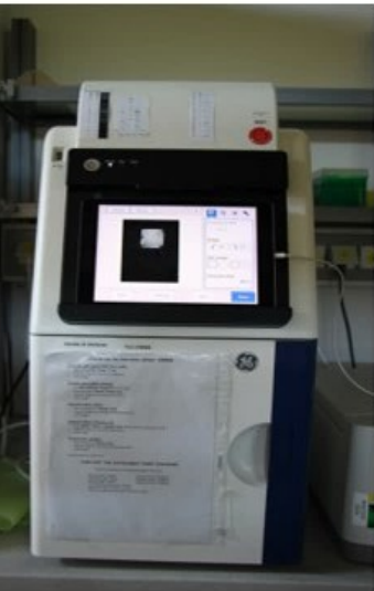
Shimadzu Imager 600 +Zubehör