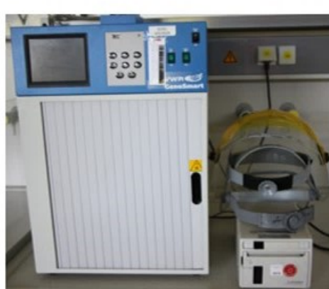
Geldoc VWR + Zubehör