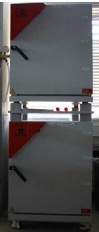
2 CO2 Inkubatoren 2 Flasche